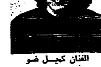
أبو سنان كجيل صو